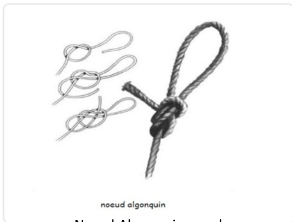
Nœud Algonquin usuel