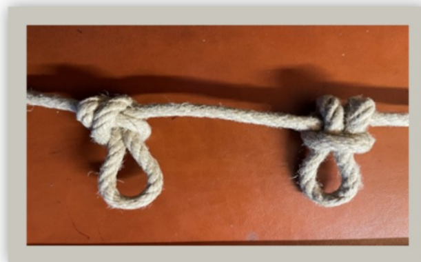
Les deux faces d'un nœud Algonquin en milieu d'un cordage

La particularité de cette méthode de nouage consiste à réaliser un nœud Algonquin usuel non pas avec le brin courant libre, mais dans le milieu d'un cordage continu (d'où l'appellation personnelle de nœud Algonquin de cordée).